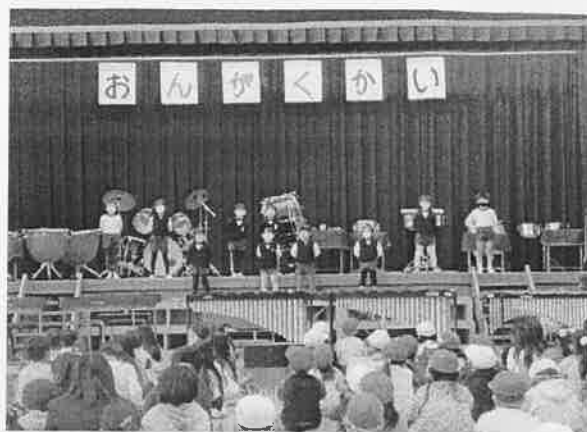
幼稚園「にじ」「夢をかなえてドラえもん」