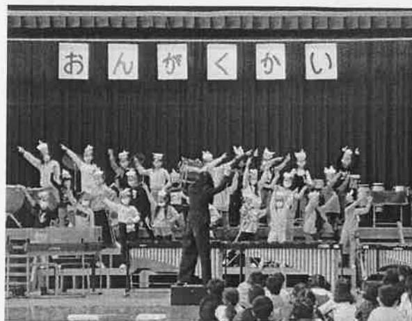
2年「ないた 赤おに」「赤鬼と青鬼のタンゴ」