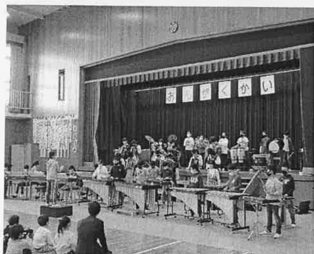
5年「ビリーブ」「夏祭り」