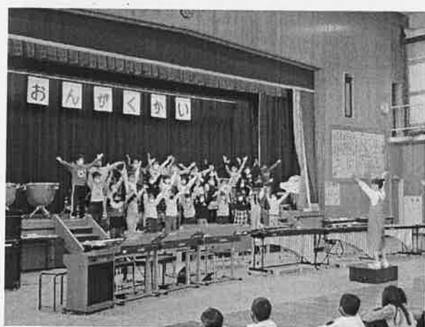
3年「森のなかま」「少年少女冒険隊」