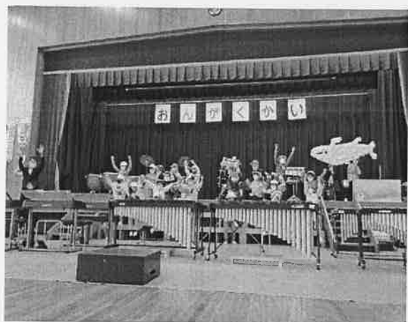
1年「くじらぐも」「こいぬのマーチ」