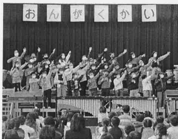
4年「ごんぎつね」「星笛」