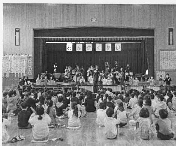
6年「ありがとうの約束」「情熱大陸」