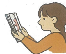
こころ からだ し 心や体を知る