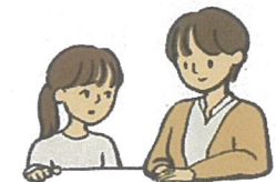
なやみのそうだん