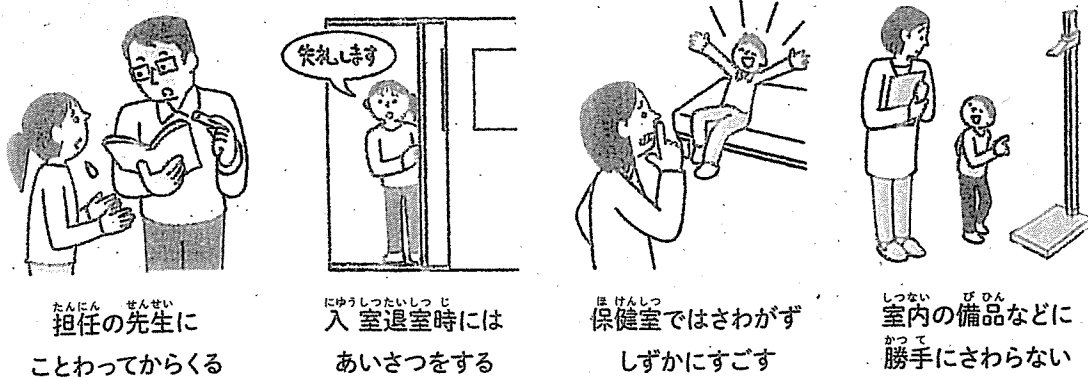
担任の先生に ことわってからくる